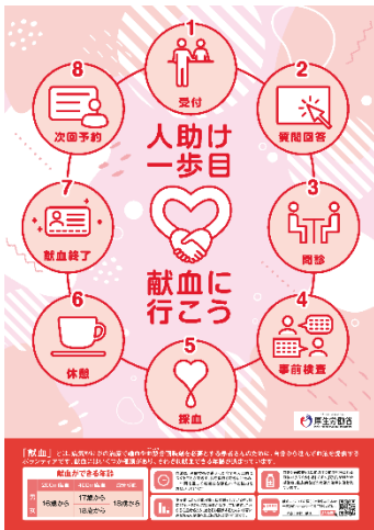
(1)③大学生等を対象とした 献血啓発ポスター